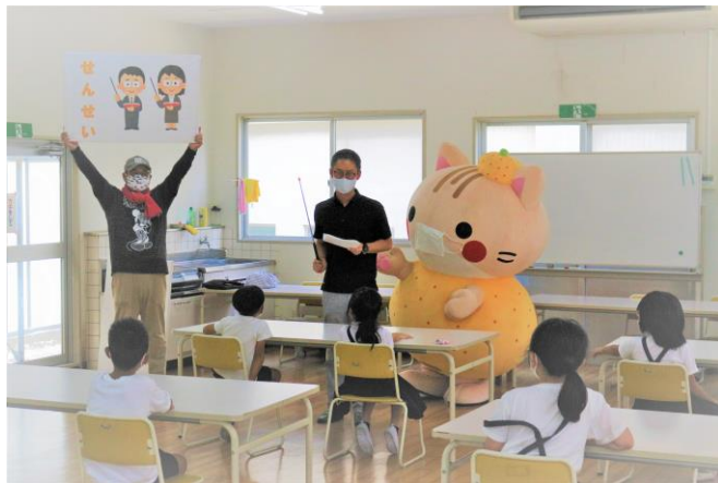
【左】1年生 みかんお菓子振興の 授業風景