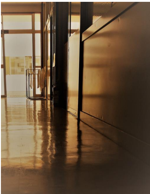
【左】新しくはないリノリウムの廊下、斜光を受けて鏡面に・・・児童の掃除の心がけや考え方が表れます。美しく保ちたいです。

③は、長い2学期をしっかりと生活して欲しいという願いから、よく考えて行動しようとよびかけました。学習面での早合点は小学生には多いことです。しっかりと読まずに、聞かずにとりかかったため、できた気持ちになったが間違っているということもあります。また、生活面では、自分の都合を最優先した結果、周りの人のことを考えてあげる余裕がなく、けんかになることなど、日常起こりがちです。まだまだ小さい子供達ですが、子供達なりに日々、選択肢の連続とも言えるかと思います。しっかりと落ち着いて一度立ち止まって考える、または考え直す事も大事にしたいと考えています。