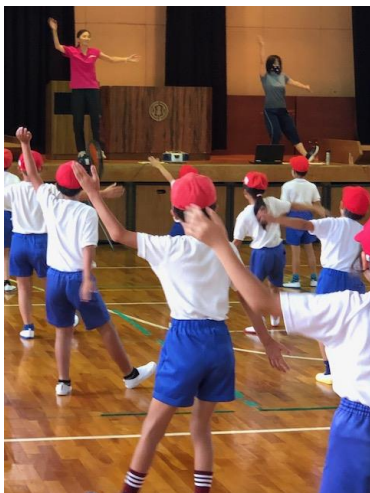
画像 左 低学年 ダンス練習初期(体育館) 下 1・2年の生活科 ゲストティーチャーを招いて