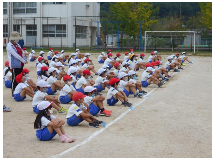
画像 上 高学年ダンス練習 右 初全体練習 左 フロントリーダー紹介

6年生は、下級生のお世話をしつつ、ぴりっと引き締まって集団を引っ張ります。下級生は、先輩の姿を見ながら後に倣います。楽しくも引き締まったたくましさを感じられる運動会にしたいと思います。ご家庭でも、ぜひお話を聞いてあげてください。