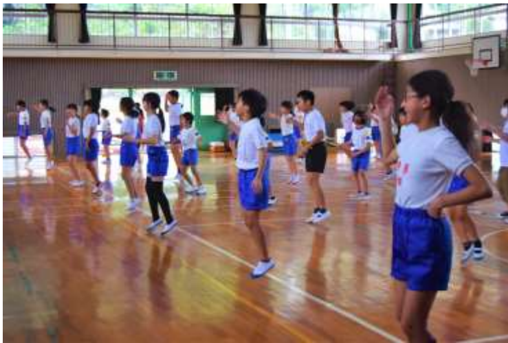
画像上 高学年ダンス「ダイナマイト」

加えて、今年は、世界中からトップアスリートが日本に集結した、TOKYO2020の年です。まだ、その余韻が残る中、本校の運動会も、その記念すべき年にちなんだ演出がされているようです。これから、競技・演技の運営も含めて、児童と教員が一体となって取組みを続けます。