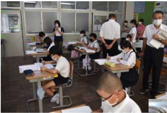
9月8日(水) 4年生研究授業(算数)