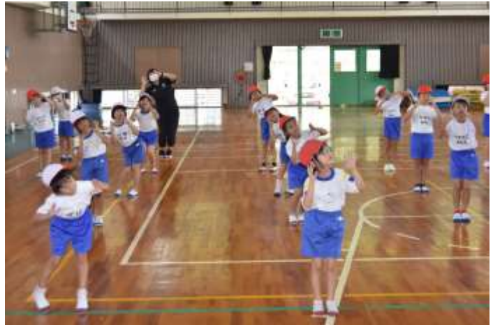
画像上 低学年ダンス練習開始

毎日、低学年・高学年それぞれの活動を見てきましたが、みんながんばって振り付けを早く覚えることができました。高学年の曲などは、けっこう速いリズムの曲もあり、こちらが目で追っていくのも難しいくらいです。