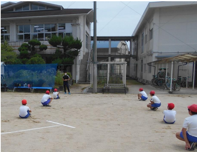
運動場で、3密回避 6年 体育の授業の風景