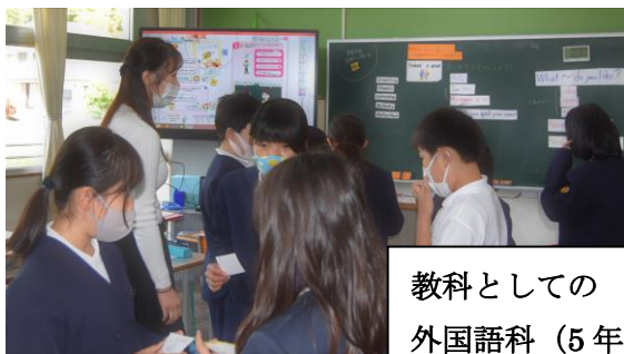
教科としての 外国語科(5年)