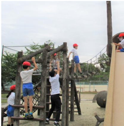
低学年 遠足 ビオトープ孟子 丸太橋で生き物観察

授業参観及び懇談会については、年間行事計画のとおり、6月24日に実施予定としています。 また、すべてのご家庭を対象に家庭訪問させていただくことは取りやめとしましたが、ご希望のご家庭には、各教室で個人面談をさせていただくよう準備しております。 よろしくお願いたします。