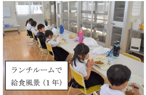
ランチルームで 給食風景(1年)

登下校はもとより、休憩時間などを中心に、いっしょに寄り添って活動してあげる優しい上級生の姿があります。時には、いっしょに運動場に出て遊ぶ姿も見受けます。みんなの力で、一年生が安心して楽しく活動できる環境を作ってくれているのが頼もしいです。